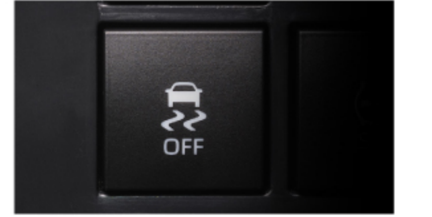
سيستمى كوتيرولكردى رايكشان نظام التحكم في الجر