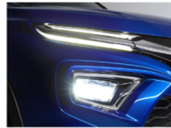
ضوء LED أمامي لايتي LED پیشموه