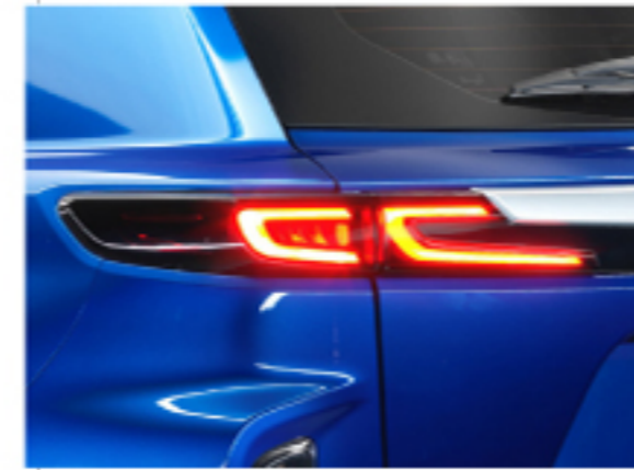
ضوء LED خلفي گلوپي دواموي LED