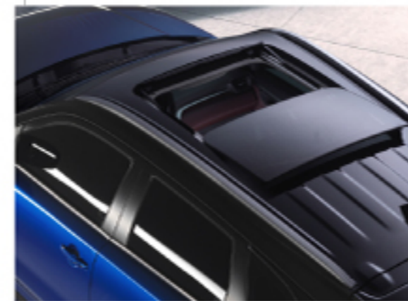
سقف بانورامي مزدوج الانزلاق سقفی بانورامی کرانهوی دووانی