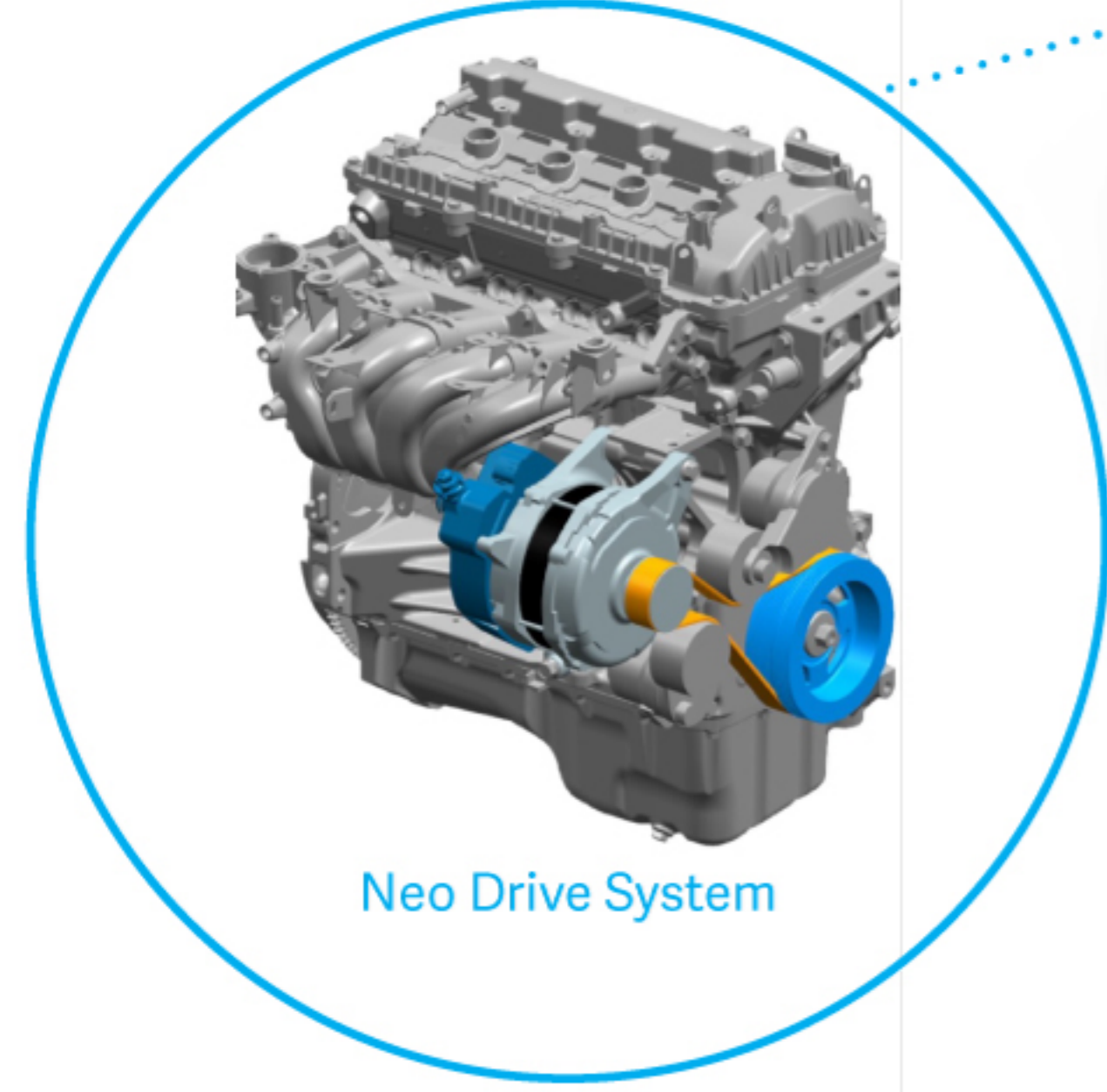
Neo Drive System