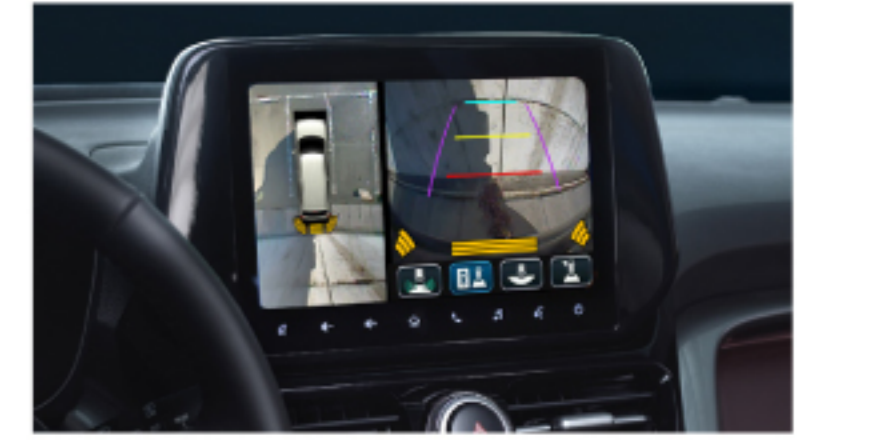
شاشمى ديمهنى دهوروبه شاشة الرؤية المحيطة

مجهزة بمجموعة متنوعة من ميزات السلامة والميزات الإضافية التي تلبى احتياجات سائقها، تعرف أوربان كروزر الجيل الجديد بالجيل التالي من سيارات الدفع الرباعي. انطلق في رحلتك الاستكشافية واثقا من أن تويوتا وحدها هي من تستطيع ترسيخها.