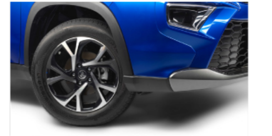
سيستمى دژه قوفلكردنى بريك نظام منع انغلاق المكابح (ABS)